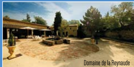
Domaine de la Reynaude

Marche : prévoir des chaussures de marche, un chapeau, un vêtement de pluie et une gourde (...+ maillot de bain).